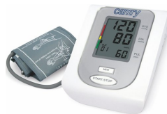
Arm blood pressure monitor CR 8409