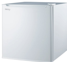
Aggregate refrigerator CR 8064