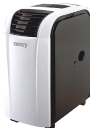
Air conditioner CR 7902