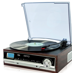
Turntable with radio CR 1113