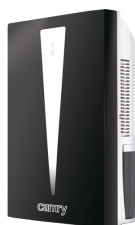
Air dehumidifier CR 7903