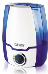
Air humidifier CR 7952