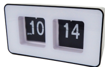
Auto-flip clock CR 1131