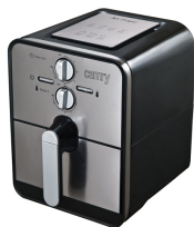
Air fryer CR 6306