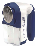
Lint remover CR 9606