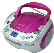
CD/MP3 player (boombox) CR 1123