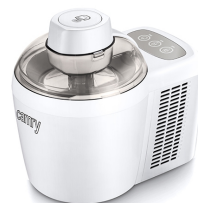
Ice Cream Maker CR 4481