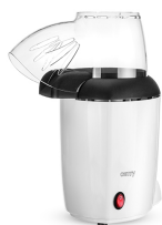
Popcorn maker CR 4458