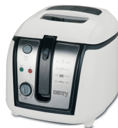
Deep fryer CR 4907