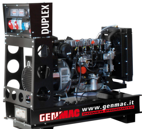
Изображение только для иллюстрации