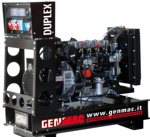
Изображение только для иллюстрации