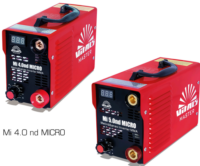
Mi 4.0 nd MICRO