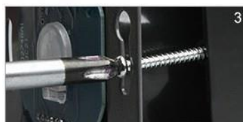
Прикрутите выключатель двумя винтами