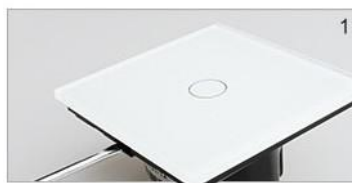
Снимите стеклянную панель отверткой