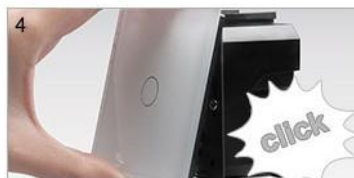
Оденьте стеклянную панель. Подайте напряжение.