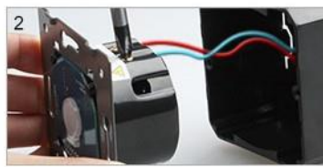
Подключите провода винтами фаза – L, лампа – L1