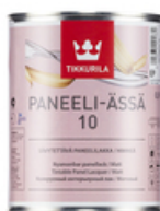
Панели-Ясса лак матовый