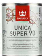
Уника Супер, глянцевый