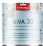
Кива 30 лак для мебели, полуматовый