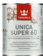
Уника Супер, полуглянцевый