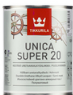
Уника Супер полуматовый