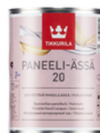
Панели-Ясса лак полуматовый