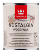
Ностальгия - воск для дерева