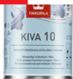
Кива 10 лак для мебели, матовый