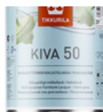
Кива 50 лак для мебели, полуглянцевый