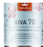
Кива 70 лак для мебели, глянцевый