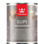
Супи Саунаваха воск - НОВИНКА!