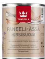
Панели-Ясса защитный состав