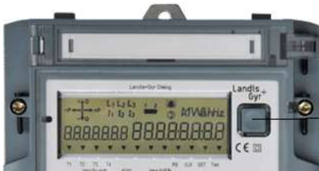
Кнопка опроса вниз