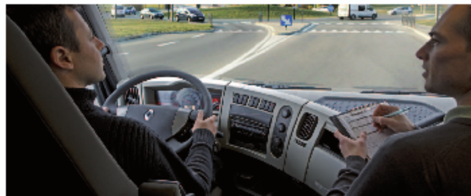
3 - ОБУЧЕНИЕ ВОДИТЕЛЕЙ

Optifuel INFOMAX можно приобрести в качестве опции при покупке нового автомобиля (22904) или же заказать в виде комплекта как комплектующие (50 01 873 756). Программное обеспечение входит в пакет программы обучения водителей Optifuel Training.