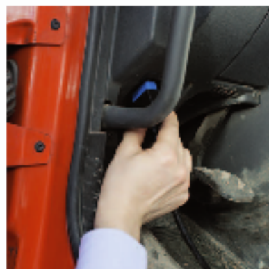
1 - ИЗВЛЕЧЕНИЕ ДАННЫХ

ВСЕГО ЛИШЬ ОДИН INFOMAX ДЛЯ ВСЕГО ВАШЕГО ПАРКА АВТО- МОБИЛЕЙ