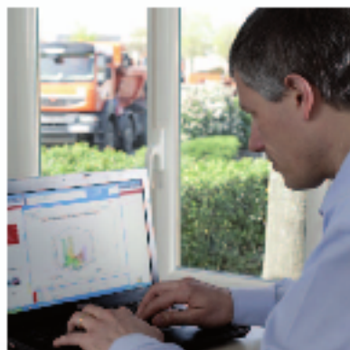
2 - АНАЛИЗ ИНФОРМАЦИИ