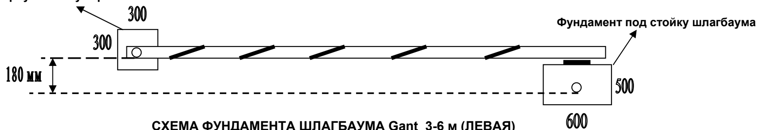
СХЕМА ФУНДАМЕНТА ШЛАГБАУМА Gant 3-6 м (ЛЕВАЯ) (вид сверху)