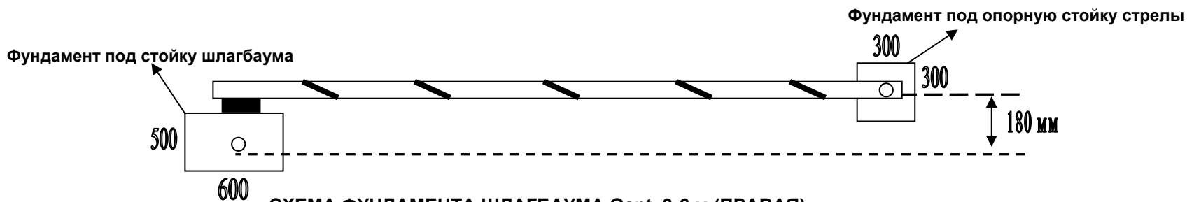
СХЕМА ФУНДАМЕНТА ШЛАГБАУМА Gant 3-6 м (ПРАВАЯ) (вид сверху)