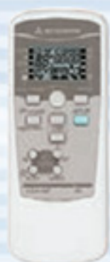
Беспроводной пульт управления