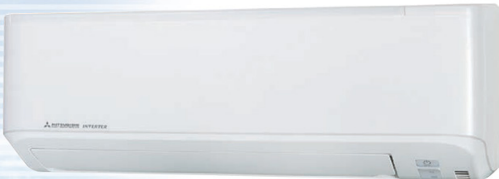
SRK20ZSPR-S, SRK25ZSPR-S, SRK35ZSPR-S, SRK45ZSPR-S