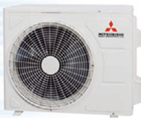
SRC20ZSPR-S SRC25ZSPR-S SRC35ZSPR-S