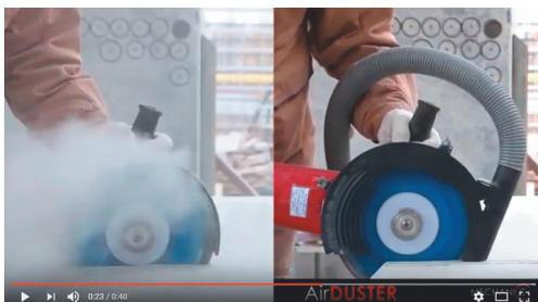
Аэродинамический кожух AirDUSTER. Пылеудаление для ВАШЕЙ углошлифовальной машины.