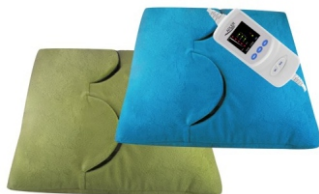
Electric heating pad AD 7403