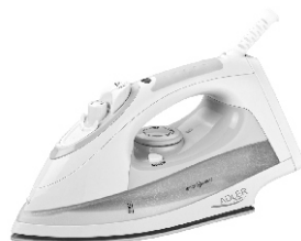
Steam Iron AD 5014