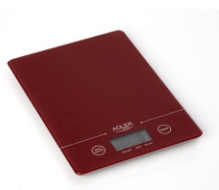
Electronic kitchen scale AD 3138