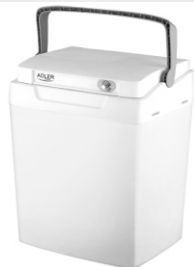
Portable cooler AD 8069