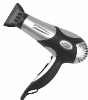
Hair Dryer AD 2224