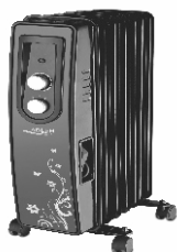
Oil-filled radiator AD 7801