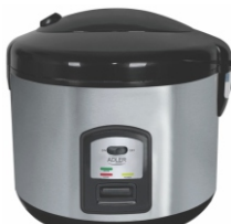
Rice cooker AD 6406