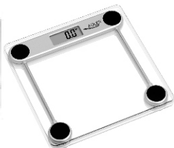
Bathroom Scale AD 8121