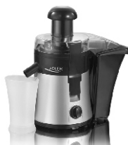
Juice Extractor AD 4106