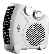
Fan heater AD 77