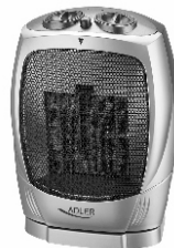
Fan Heater AD 7703