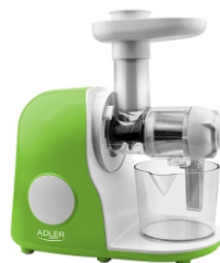
Slow juicer AD 4113