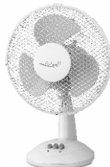
Table Fan AD 7302