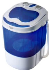
Mini washing machine with spinning function AD 8051