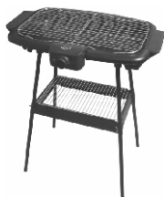
Electric grill AD 6602