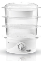
Steam cooker AD 633