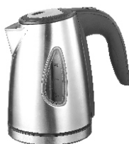
Kettle AD 1203