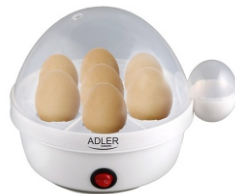
Egg boiler AD 4459