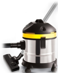
Canister vacuum cleaner AD 7022