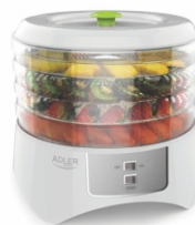
Food dryer AD 6654