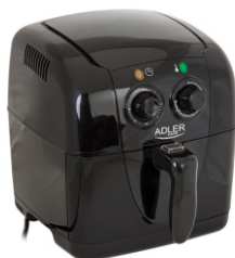
Air fryer AD 6307