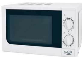
Microwave oven with grill AD 6204