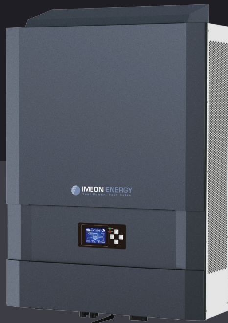
IMEON 9.12 Трифазне рішення