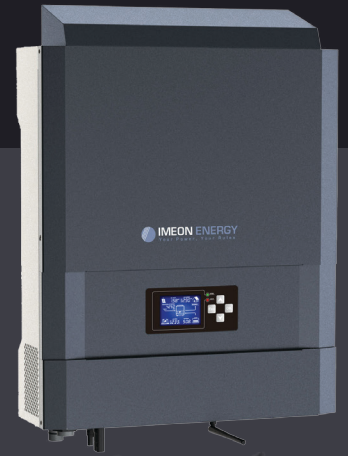
IMEON 3.6 Однофазне рішення