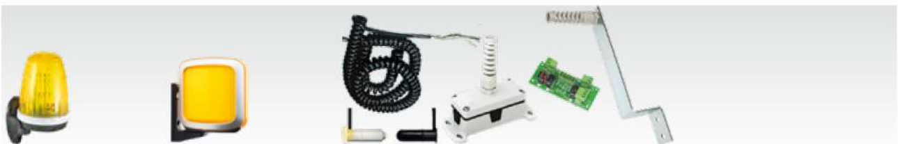
F5000 / F5002

Фотолинейки в комплекте (длиной 193 / 229 / 265 мм)