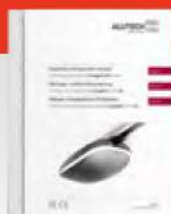
Руководство по монтажу и эксплуатации на русском языке.

! Рейка не входит в комплект и поставляется отдельно.