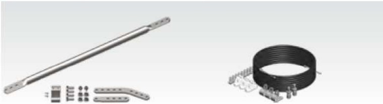
LGE-1000 / LGE-1500

Удлинительная тяга для высокого монтажа ворот