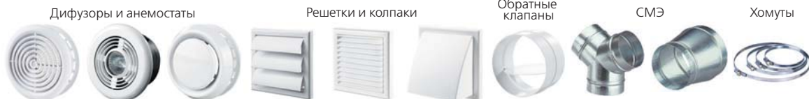
Диффузоры и анемостаты