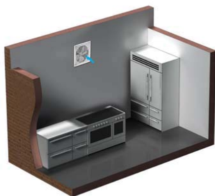
Вариант применения вентилятора OB1 P на кухне