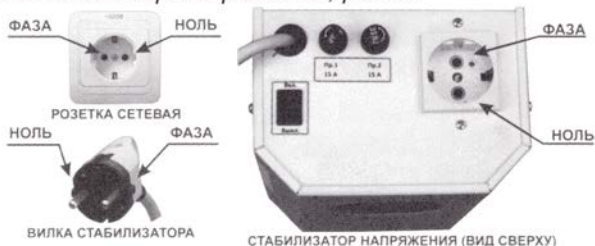
Рис. 3. Фазировка элементов системы.

ВНИМАНИЕ: если для питания нагрузки (котла отопления) требуется фазировка, то необходимо сфазировать все элементы системы: и нагрузку и стабилизатор напряжения, рис.3.