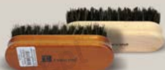
„12“ 621/12 light i 621/15 dark

EN Brushes for polishing are of different sizes, shapes, different wooden finishing and hair composition. The brush usually has mixed hair – natural horse hair mixed with a synthetic one. Wood can be stained dark colours and painted or stained light colours and unfinished. DE Polierbürsten haben verschiedene Größen, Formen, Holz Ausführungen und unterschiedliche Haar-Zusammensetzung. Am häufigsten ist es gemischtes Haar - natürliches Rosshaar mit synthetischem Haar. Das Holz kann dunkel gebeizt und lackiert oder hell, ohne Appretur sein. RU