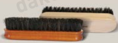
„16“ 621/2 light i 621/3 dark