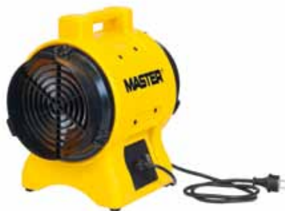
BL 4800 BL 6800