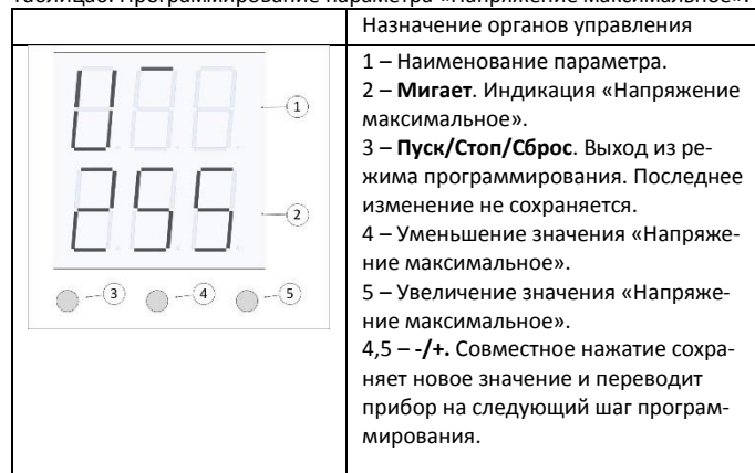
Таблица6. Программирование параметра «Напряжение максимальное».