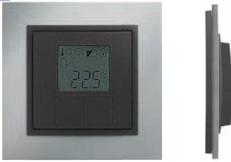
Плоское исполнение - глубина устройства всего 20 мм!