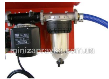
С фильтром-сепаратором воды с прозрачным корпусом Clear Captor