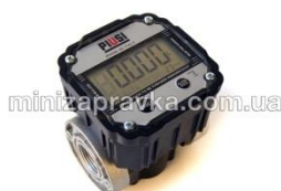
Электронный счетчик К600В/3 з большим дисплеем