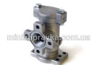
фильр грубой очистки