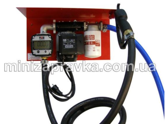
миниА3С с счетчиком К600В/3 с большим дисплеем