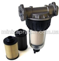
Фильтр с прозр.колбой