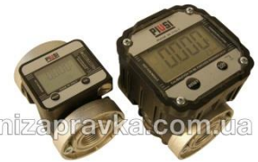
K600 - K600B/3