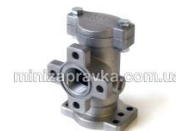
фильтр грубой очистки