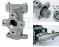
Фильтр грубой очистки