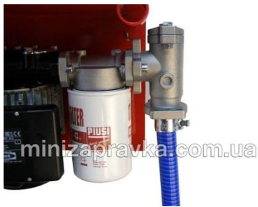
С фильтром тонкой очистки CF60 и фильтром грубой очистки