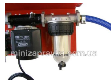
С фильтром-сепаратором воды с прозрачным корпусом Clear Captor