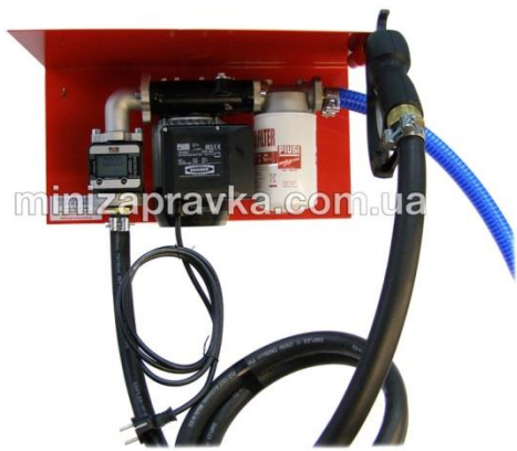
миниА3С с счетчиком К600