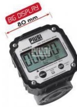
K600B/3 с бол.дисплеем