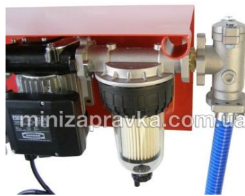
С фильтром-сепаратором воды с прозрачным корпусом Clear Captor и фильтром грубой очистки