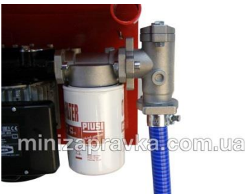
С фильтром тонкой очистки CF60 и фильтром грубой очистки

Обратный клапан ( для исключения возврата топлива в топливный бак )