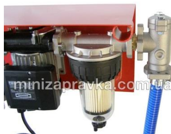
С фильтром-сепаратором воды с прозрачным корпусом Clear Captor и фильтром грубой очистки