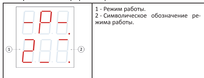
Таблица 3. Меню выбора режима работы.

Меню выбора режима работы вызывается из основного меню при одновременном нажатии кнопок «-/t - » и «+/t + ». В данном меню верхний индикатор отображает символы «-P-», а нижний индикатор - мигающее значение (см. табл. 3). Это значение определяет режим работы устройства. Нажатие кнопки «-/t - » или «+/t + » позволяет установить необходимый режим работы. При отсутствии действий в течении 60 секунд или нажатии кнопки «Выход», устройство возвращается в основное меню.