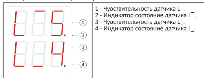
Таблица 4. Меню настройки чувствительности датчиков.

Важно. Для правильной настройки чувствительности необходимо сначала наполнить емкость жидкостью так, чтобы верхний датчик L_+ был погружен в жидкость. Диапазон значений чувствительности датчика - от 0 (самая низкая чувствительность) до 9 (самая высокая чувствительность). В меню настройки чувствительности датчиков установите требуемое значение для L_+ . Чувствительность необходимо увеличивать до уверенного срабатывания датчика (лучше с небольшим запасом). На срабатывание датчика указывает загорание точки индикатора. Не стоит устанавливать чувствительность намного больше необходимой. Это может привести к ложным срабатываниям датчика в сухом состоянии.