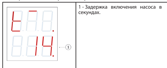
Таблица 5. Меню настройки задержки включения насоса.

Меню настройки задержки включения насоса вызывается из основного меню при нажатии кнопки «+/t + ». В данном меню верхний индикатор отображает символы «t + » а нижний индикатор - мигающее значение (см. табл. 5). Это значение определяет текущее значение задержки t_+ в секундах. Редактировать значение можно нажатиями кнопок «-/t - » или «+/t + ». При отсутствии действий в течении 60 секунд или нажатии кнопки «Выход», устройство возвращается в основное меню.