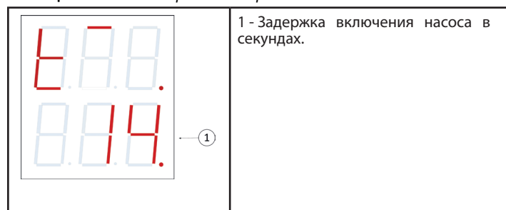
Таблица 5. Меню настройки задержки включения насоса.

Меню настройки задержки включения насоса вызывается из основного меню при нажатии кнопки «+/t + ». В данном меню верхний индикатор отображает символы «t + » а нижний индикатор - мигающее значение (см. табл. 5). Это значение определяет текущее значение задержки t + в секундах. Редактировать значение можно нажатиями кнопок «-/t - » или «+/t + ». При отсутствии действий в течении 60 секунд или нажатии кнопки «Выход», устройство возвращается в основное меню.