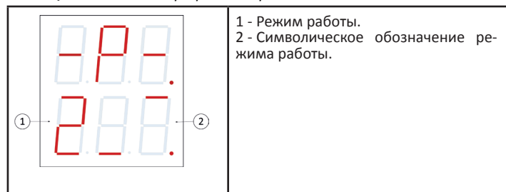
Таблица 3. Меню выбора режима работы.

Меню выбора режима работы вызывается из основного меню при одновременном нажатии кнопок «-/t - » и «+/t + ». В данном меню верхний индикатор отображает символы «-P-», а нижний индикатор - мигающее значение (см. табл. 3). Это значение определяет режим работы устройства. Нажатие кнопок «-/t - » или «+/t + » позволяет установить необходимый режим работы. При отсутствии действий в течении 60 секунд или нажатии кнопки «Выход», устройство возвращается в основное меню.