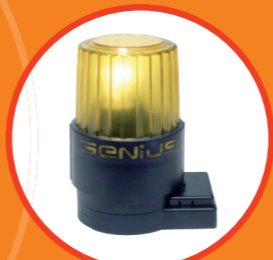
Сигнальная лампа Служит для зрительного оповещения о движении ворот