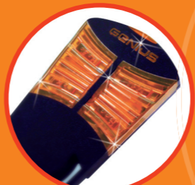
Радиобрелок-пульт Служит для дистанционного управления воротами