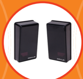
Фотоэлементы Служат для обнаружения объекта в зоне действия