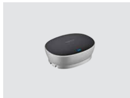
ПОДКЛЮЧЕНИЕ И ИСПОЛЬЗОВАНИЕ

Расширьте радиус слышимости с 6 до 8,5 м, чтобы даже голоса людей, сидящих далеко от устройства громкой связи, были хорошо слышны собеседникам. Микрофоны продаются парой; система автоматически распознает и настраивает их — достаточно подключить микрофоны к устройству громкой связи.