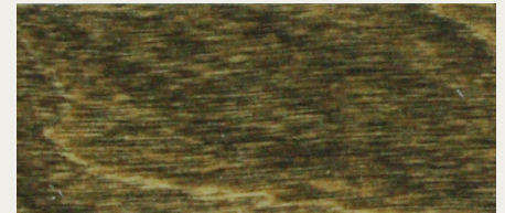
Eiche antik (Art. 483)