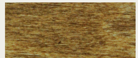
Nussbaum (Art. 485)