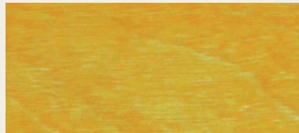
Kiefer (Art. 480)

Diese Online-Farbkarte dient ausschließlich der groben Orientierung. Wir weisen darauf hin, dass die Farbtöne durch verschiedene Monitore und deren verschiedene Einstellungen nicht korrekt dargestellt werden können. Gleiches gilt auch für den Ausdruck dieser Farbkarte. Um einen besseren oder originalgetreuen Eindruck von den Farben zu bekommen, empfehlen wir den Erwerb unserer Farbkarten mit Original-Anstrichen oder unserer gedruckten kostenlosen Flyer.