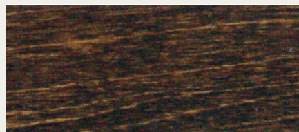
Wenge (Art. 486)