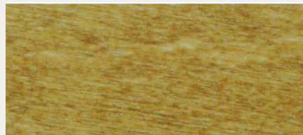
Eiche hell (Art. 482)