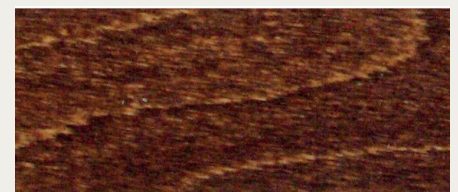
Palisander (Art. 487)