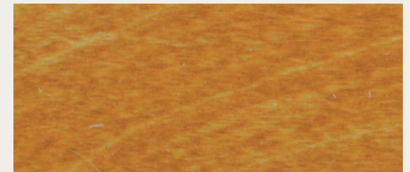
Lärche (Art. 481)