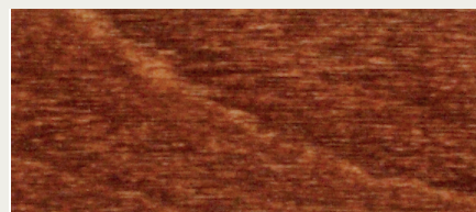
Teak (Art. 484)