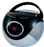
BOOMBOX RADIO AD 1125