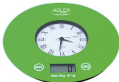
KITCHEN SCALE AD 3144