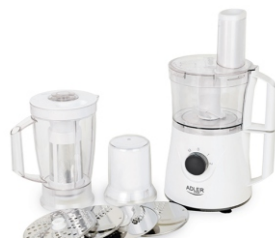
MULTI ROBOT AD 4055