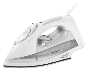
Steam Iron AD 5014