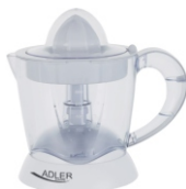
CITRUS JUICER AD 4003