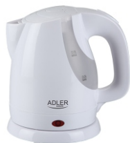
ELECTRIC KETTLE AD 1233