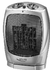
Fan Heater AD 7703