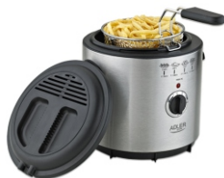
DEEP FRYER AD 4905