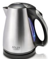
ELECTRIC KETTLE AD1238