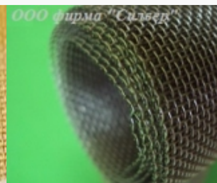
Сетка тканая нержавеющая