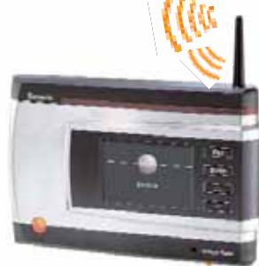
База testo Saveris

База является сердцем измерительной системы testo Saveris и может сохранять данные 40,000 измерений на один измерительный канал в независимости от подключения к ПК. Это соответствует одному году измерений при измерительном цикле в 15 минут. Данные системы и сигналы тревоги отображаются на дисплее Базы testo Saveris.