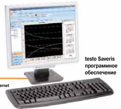
testo Saveris программное обеспечение

Программное обеспечение testo Saveris software предлагает простое и интуитивное управление через интерфейс пользователя. Программное обеспечение testo Saveris предлагается в 2 различных версиях: базовая версия SBE (Small Business Edition) или версия PROF (Профессиональная) с различными дополнительными опциями. В случае необходимости в удаленном доступе к месту замера, можно использовать удаленный доступ через Интернет для отображения измеренных значений.