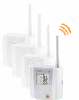
testo Saveris радиозонд