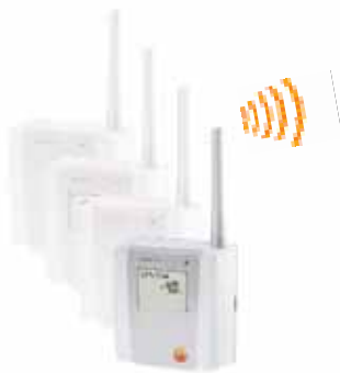
testo Saveris радиозонд

Различные версии зондов с внутренними и внешними сенсорами температуры и влажности позволяют адаптировать систему к любым сферам применения. Радио зонды могут поставляться в версии с дисплеем или без дисплея. Память данных зонда дает уверенность в том, что данные измерений не будут утеряны, даже в случае помех или сбоев в радиосвязи. Текущее измеренное значение, состояние батареи и качество радиосигнала отображаются на дисплее.