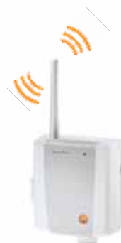
testo Saveris маршрутизатор

Возможно расширение системы с помощью Ethernet зондов