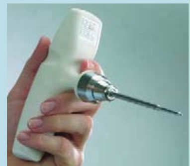
Три различных измерительных наконечника для разных сфер применения