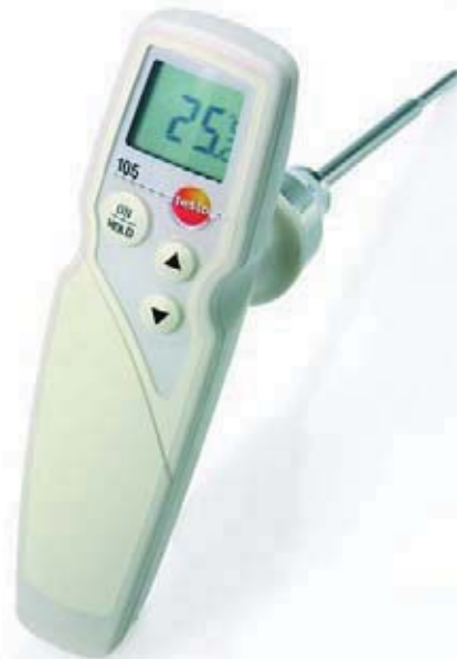
Прочный пищевой термометр со сменными измерительными наконечниками

Профессиональный прибор измерения температуры для пищевой отрасли