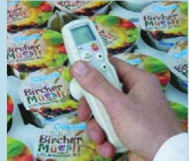
Точные измерения температуры поступающих продуктов с сигналом тревоги при выходе из заданных значений