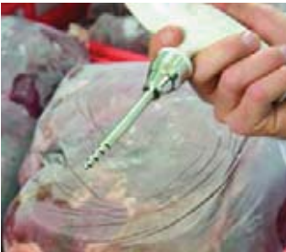
Специальный измерительный наконечник для замороженных продуктов