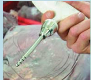
Специальный сменный наконечник для замороженных продуктов