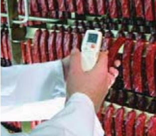
Быстрые и удобные измерения на производстве