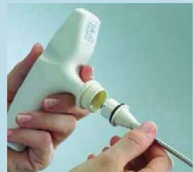
Легкая замена измерительного наконечника