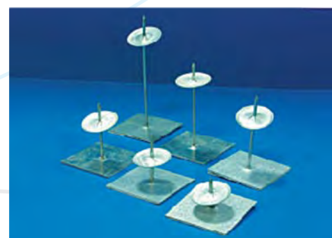
В упаковке 100 штук.